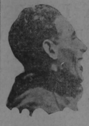
MAYOR CARLOS DEL PRETE

RIO DE JANEIRO, 16. — El aviador italiano, Mayor del Prete, falleció como buen cristiano, leal a su lado a Moiseoro, Tora al Embajador Italiano en esta capital, a su compañero de vuelo, Capitán Ferrarini, y algunas otras personas. La policía de su muerte produjo enorme consternación en el público estacionado frente al hospital en espera de noticias desde que se supo que se le iba a amputar la pierna derecha. Las últimas horas las pasó Del Prete en estado de inconciencia.